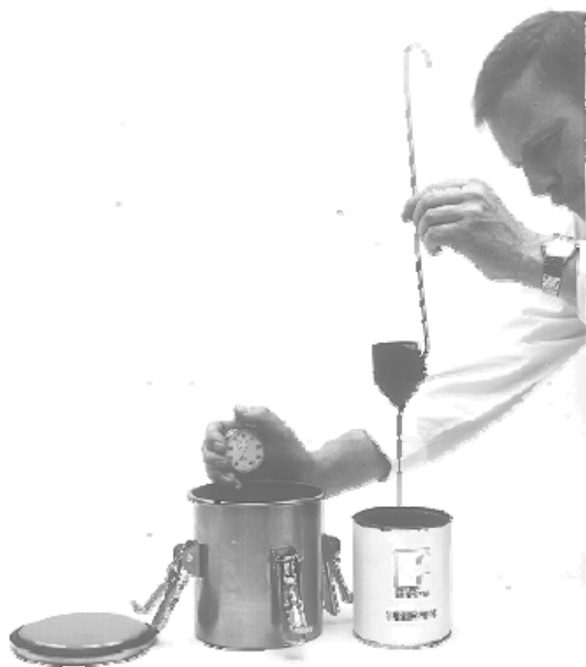
Рис.2 Мерная чашка в соответствии с DIN 62 211 для измерения вязкости краски